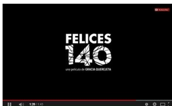
FELICES 140 , de Gracia Querejeta

Tornasol Films / Hernández y Fernández PC / Foresta Films / La ignorancia de la sangre AIE